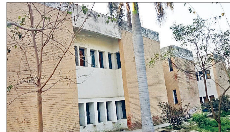
कैथल। राजकीय आईटीआई कैथल का कंडम किया गया पुराना भवन।

प्रदेश भर में चलाए जा रहे राजकीय आईटीआई में अब विद्यार्थी जर्जर व खंडहर भवनों में प्रशिक्षण नहीं लेंगे। विद्यार्थियों की सुरक्षा को लेकर कौशल विकास एवं औद्योगिक प्रशिक्षण विभाग हरियाणा ने सख्त कदम उठाया है। निदेशालय द्वारा प्रदेश भर के सभी राजकीय आईटीआई के मुखियाओं को पत्र जारी करते हुए जर्जर व खंडहर भवनों में कक्षाएं न लगाए जाने के आदेश दिए हैं। इन आदेशों ने आईटीआई मुखियाओं की चिंता बड़ा दी है क्योंकि निदेशालय ने कक्षा न लगाने के आदेश तो जारी कर दिए हैं लेकिन अभी तक इन जर्जर भवनों के स्थान पर नए भवन नहीं बनाए गए हैं। गौरतलब है कि दिसंबर माह में कौशल विकास एवं औद्योगिक प्रशिक्षण विभाग और लोक निर्माण विभाग की टीम द्वारा संयुक्त रूप से प्रदेश के सभी राजकीय आईटीआई के भवनों का निरीक्षण किया था। निरीक्षण के दौरान कई कमरों की छतों में दरारें, दीवारों में सीलन, प्लास्टर उखड़ना