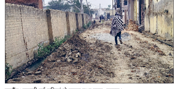
राजौड़। उखाड़ी गई गलियां से रास्ता हुआ उड़-खाड़।

राजौड़। शहर के विभिन्न वार्डों में सफाई व्यवस्था सुचारु न होने से लोगों में असंतोष बढ़ता जा रहा है। कई गलियां उखाड़ कर बीच में ही छोड़ दी गईं, जो ह्र वार्ड की समस्या है। इसके अलावा गलियों की नियमित सफाई न होने से गंद पानी सड़कों पर बह रहा है, जिससे राहगीरों और स्थानीय निवासियों को भारी परेशानी का सामना करना पड़ रहा है। आसपास रहने वाले लोगों का कहना है कि कई बार शिकायत करने के बावजूद समस्या का स्थायी समाधान नहीं हो पाया है। ऐसे में लोग गवाल उठा रहे हैं कि समस्या संसाधनों की कमी के कारण है या फिर निगरानी तंत्र में दिलाई के चलते है। नगर पालिका क्षेत्र में शामिल गांव खुरडा की स्थिति भी बेहतर नहीं बताई जा रही। ग्रामीण क्षेत्रों में गंदगी जमा रहने से गलियों में जलभराव और बदबू की समस्या बनी हुई है। स्थानीय निवासियों का कहना है कि शिकायतों के बावजूद समय पर कार्यवाई नहीं होती।