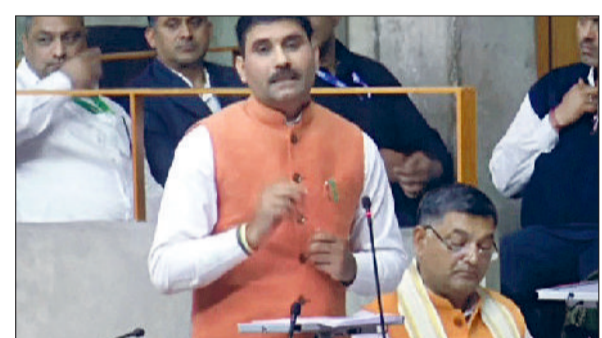
कैथल। विधायक सतपाल जांबा विधानसभा में अपनी मांग रखते हुए।

विधायक सतपाल जांबा ने विधानसभा में पुंडरी क्षेत्र के विकास कार्य के लिए रखी महत्वपूर्ण मांग