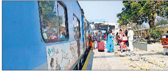
जींद। रेलवे जंक्शन पर मौजूद यात्री।